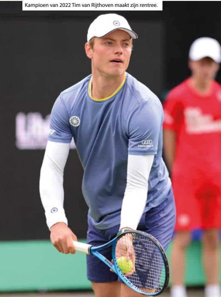
Kampioen van 2022 Tim van Rijthoven maakt zijn rentree.