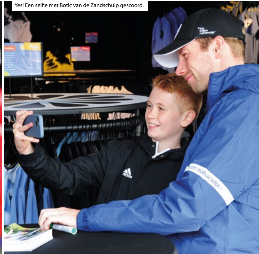
Yes! Een selfie met Botic van de Zandschulp gescoord.