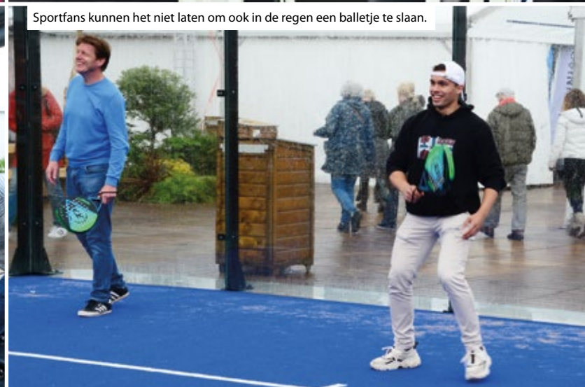
Sportfans kunnen het niet laten om ook in de regen een balletje te slaan.