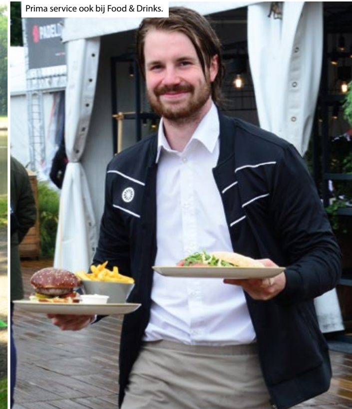
Prima service ook bij Food & Drinks.