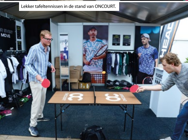
Lekker tafeltennissen in de stand van ONCOURT.