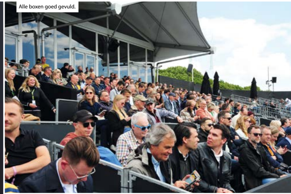
Alle boxen goed gevuld.