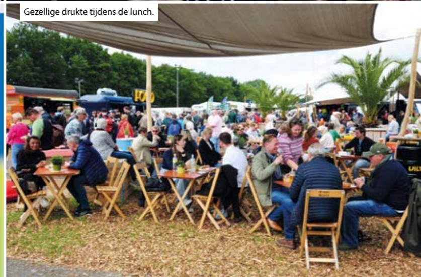
Gezellige drukte tijdens de lunch.