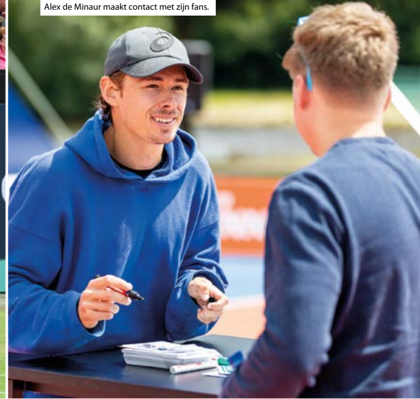
Alex de Minaur maakt contact met zijn fans.