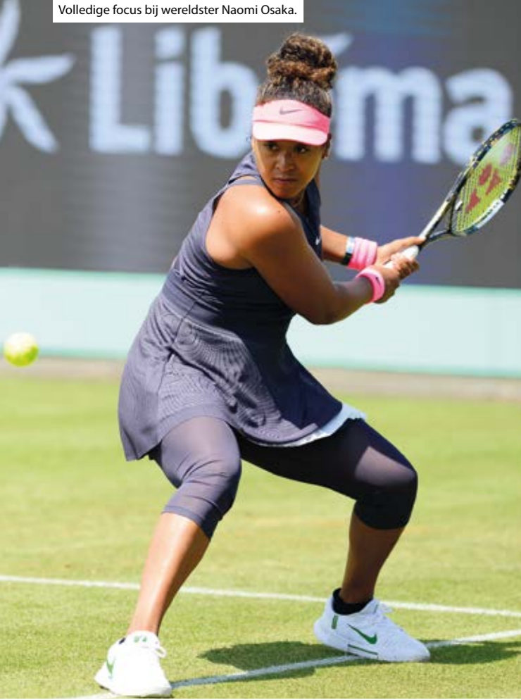
Volledige focus bij wereldster Naomi Osaka.