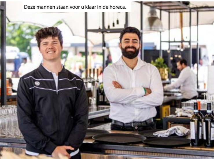
Deze mannen staan voor u klaar in de horeca.